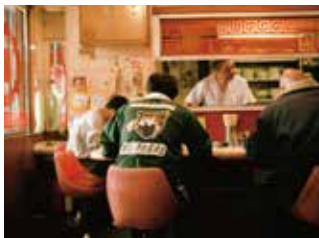
作家推薦団体 東京藝術大学大学院映像研究科映画専攻 制作プロダクション TOHOスタジオ