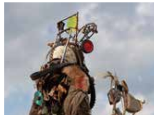
作家推薦団体 ショートショート フィルムフェスティバル & アジア 制作プロダクション キリシマ一九四五