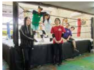
作家推薦団体 TAMA映画フォーラム実行委員会 制作プロダクション ROBOT