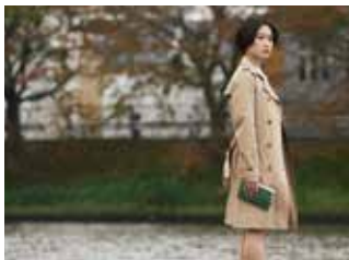
作家推薦団体 日本アド・コンテンツ制作協会 制作プロダクション レスパシフィルム